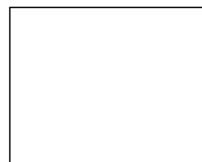
Nakresli list jahody